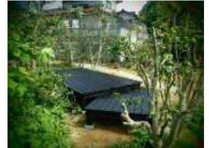
お庭の手入れとウッドデッキ

観葉植物・松盆栽・コチョウランなどをリースいたします。オフィス・店舗・ご自宅に緑の空間を演出してみませんか。