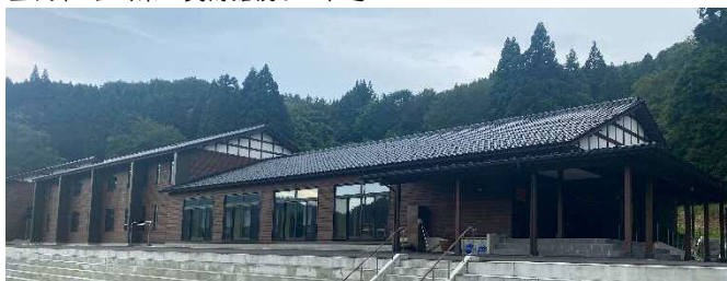
津幡町 河合谷宿泊交流施設「河愛の里 Kinschule (キンシュレ)」