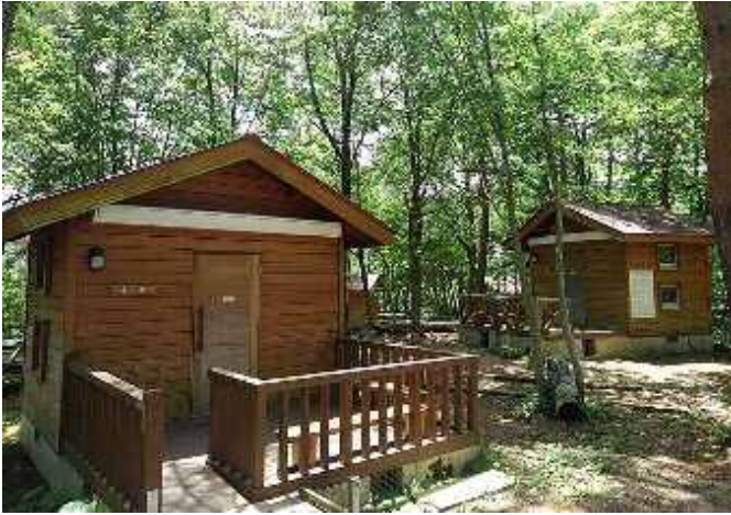
4人用バンガローAタイプ