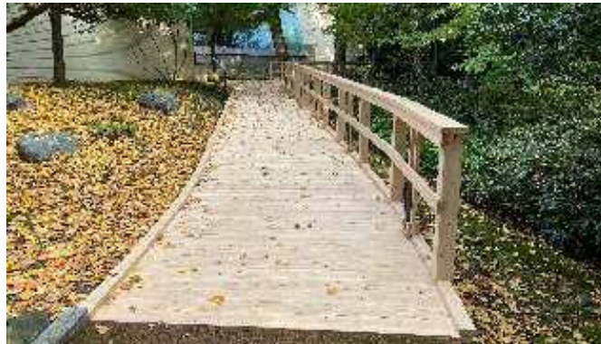
金沢市 石川県立美術館後ろの木道