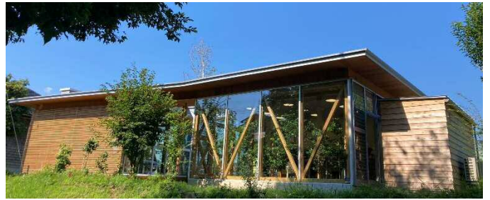
金沢産木材をふんだんに使った新事務所